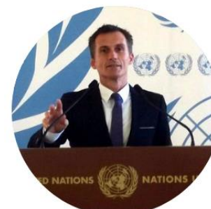
Микель Мансисидор де ла Фуэнте

Почетный профессор международного и сравнительного права Университета Квинс (Белфаст)